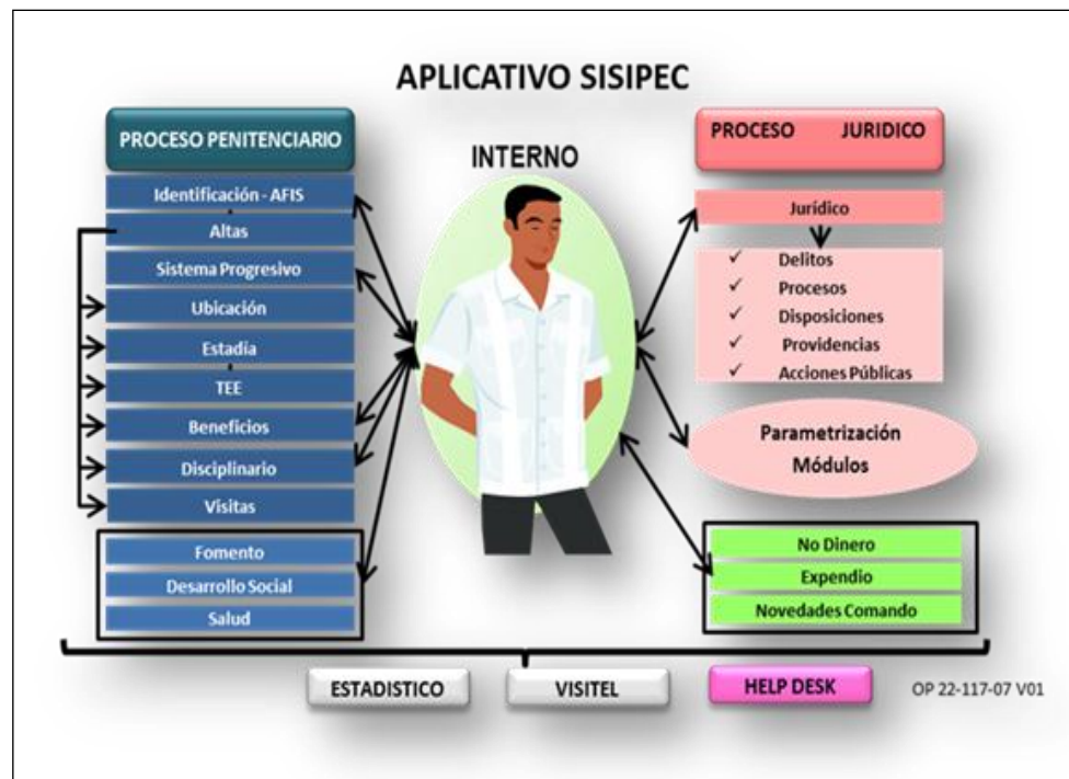
Ilustración 1 Aplicativo SISIEPEC

158. A continuación se detallan los componentes del proyecto: